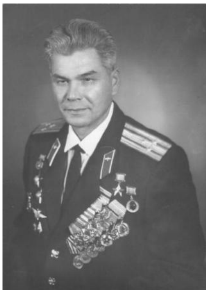
Герой Советского Союза, заслуженный военный летчик, полковник Трофимов Евгений Федорович. Начальник АВВАКУЛ ПВО 1970 – 1972 г.г.

Казарма имела два входа по краям, а перед ней располагался плац для построений. Помещение, в котором расположилась наша рота, занимало весь первый этаж здания. Этаж был разделен на два помещения со сквозным проходом посередине. Часть кроватей стояли в два яруса, так же как и в палатках. Да и невозможно было разместить сто семьдесят с лишним человек на одном ярусе. Это уже на втором курсе был только один ярус, так как много ребят списали после первых полетов «по нелетной». Но, об этом расскажу дальше.