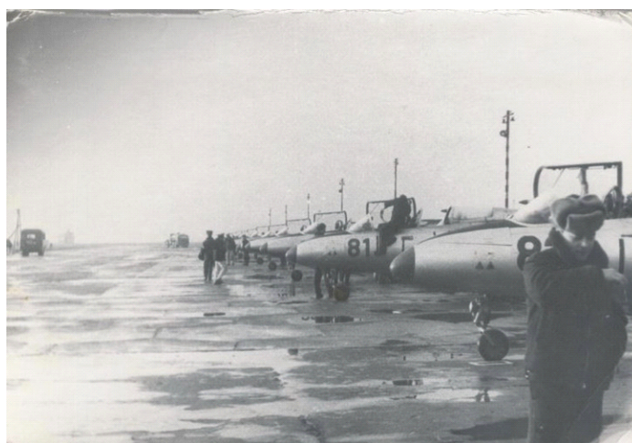
Центральная заправочная стоянка (ЦЗС)

нашим спальным помещением. Техниками звеньев были уже офицеры. У нас с ними сложились прекрасные отношения, мы не «разводили понты», что мы летчики, а они – что были старше нас. Мы помогали им заправлять самолеты, а они помогали нам одевать парашютную систему в кабине, контролировали запуск, газовку самолета, закрытие и герметизацию кабины. И как испокон веков сложилось, ждали нашего возвращения на землю. Иногда устраивали соревнования по волейболу с ними, делились новостями из дома. Среди них мы находили и земляков. Мы ощущали себя одной семьей. Иногда подшучивали над ними, собственно так-же, как и они над нами.