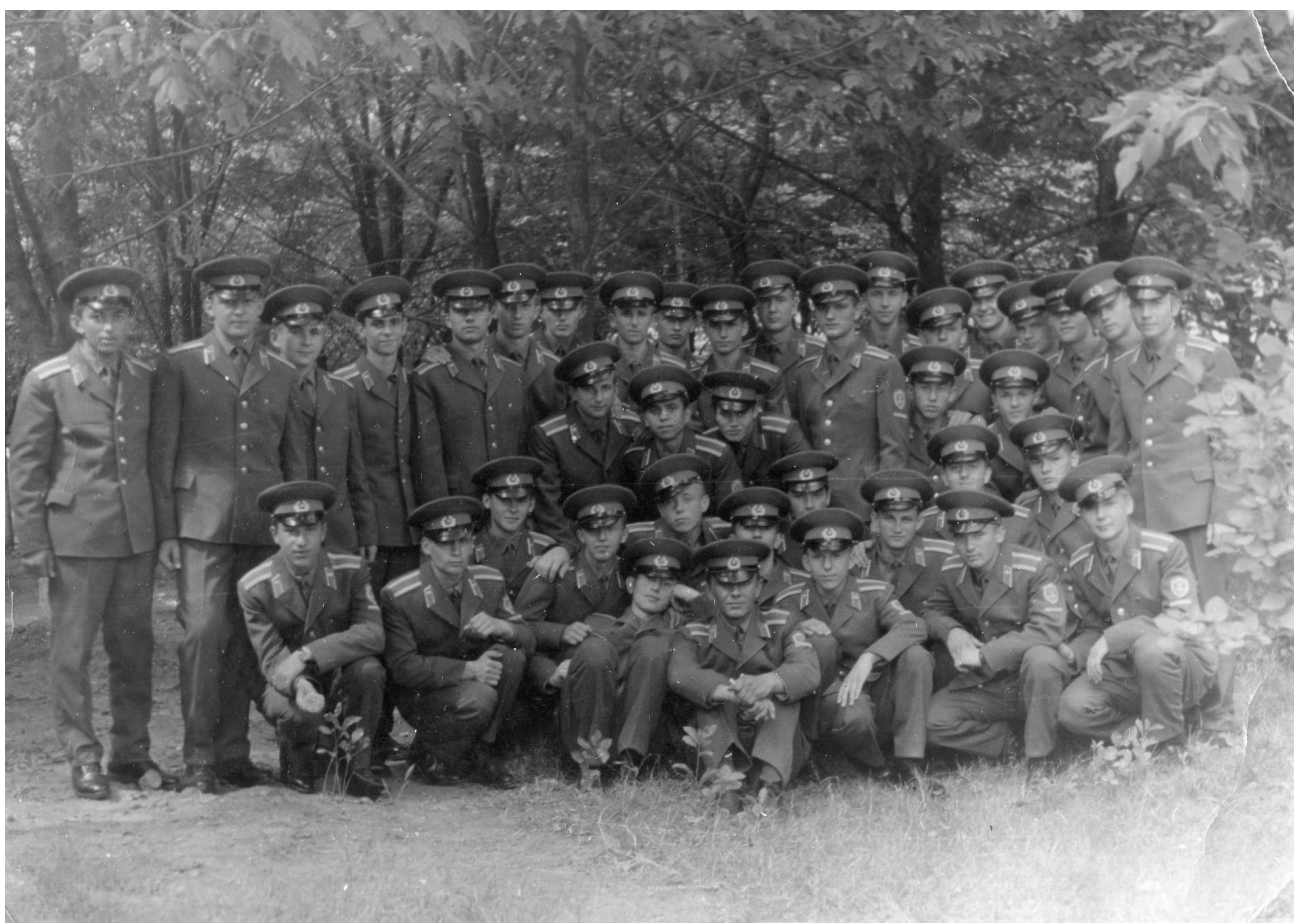
Наш взвод после принятия присяги.

курса АВВАКУЛ. Пока мы ходили строевой и изучали уставы, в учебном отделе училища кипела работа. Там версталось расписание для учебных групп нашего курса. И так-же, как и в школах, это расписание вывешивалось на первом этаже в холле нового учебного корпуса. Был и старый учебный корпус, трехэтажный, кирпичный, построенный видимо сразу-же после войны. В новом-же было четыре этажа и больше стекла и бетона. В нем были широкие коридоры и большие холлы на каждом этаже. А между корпусами была разбита аллея, в которой стояли на пьедесталах бюсты Героев Советского Союза, окончивших Армавирское училище. В середине аллеи был небольшой круглый фонтан в центре которого на камнях в виде альпийской горки была установлена фигура девушки с платком в руке и маленький самолетик. Когда фонтан запускали, то самолетик как-бы летал по кругу над девушкой, а с ним крутилась и девушка, махавшая платком этому самолетику. Конечно, это был не шедевр фонтанного искусства, но эта композиция была настолько близка молодым здоровым юношам, решившим связать свою жизнь с небом, что стала одним из символов училища. В самом парке росли плакучие ивы и каштаны. Стояли садовые скамейки, на которых мы иногда, когда выпадала свободная минута, отдыхали.