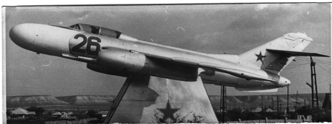
Як-25 на постаменте у КПП полка. Полк был боевым и летал на них до переучивания на Л-29 и передачи полка Армавирскому ВВАКУЛ.

Внутренне я был напряжен, но заняв место в кабине, немного успокоился. Я предполагал, что допуск к самостоятельному вылету будет давать мне не командир звена. Думал что замкомэск или командир АЭ, но чтобы выпускал сам «батя», я и не предполагал. Запустили двигатель, а дальше, как учил инструктор. Самое трудное было выдержать спокойствие на протяжении этих трех полетов.