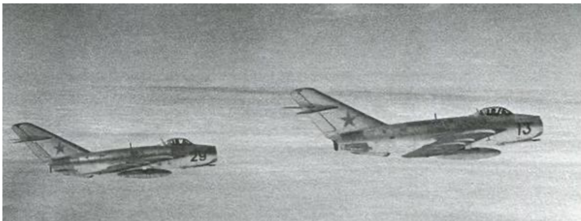
Полет парой. Миг-17.

Полеты полетами, но за лесопосадкой стал поспевать подсолнечник. Уж и не знаю, кто придумал или подсказал, но мы стали жарить семечки прямо в самолетном сопле. Перед полетами мы бегали на поле и, выбрав самую большую шляпку подсолнечника, оббивали самые крупные семечки по краям подсолнуха в сумку из под маски. Чтобы наполнить сумку, надо было три-четыре шляпы срезать и обмолотить. И только потом шли на полеты на аэродром, был-то он в двух шагах от казарм. Сама технология была простой: самолет заруливает, выключает двигатель, его закатывают на ЦЗ и вот тут самое время высыпать в сопло семечки из сумки. Семечки надо мешать, а из жерла жаровой трубы в лицо бьет обжигающий жар. Лицо закрываешь сумкой, а пилоткой мешаешь семечки, чтобы не подгорели. Но одного Миг-17 было мало, семечки получаются недожаренными. Поэтому после первого, дожаривали в другом. Но если передержать, то они сгорали. Нашли выход быстро. После боевого дожаривали в спарке, семечки получались изумительно вкусные. Таких семечек невозможно получить ни при какой другой жарке. А все дело было в том, что у боевого температура на выходе из жаровой трубы в полете была 750 градусов, а у спарки 650 градусов.