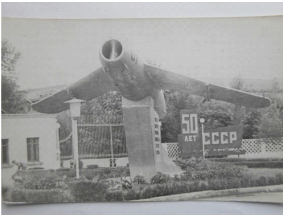
Этот МиГ-17 на постаменте встречал первым всех абитуриентов, приехавших поступать в училище.

Кто-то из пассажиров подсказал мне остановку училища и я вышел, не доехав до центрального КПП двести метров. Когда прошел вдоль бетонного забора училища и оказался у КПП, сердце забилось, что вот она цель всех моих усилий! Вход в училище узнал сразу, так как на площадке перед КПП на стеле красовался МиГ-17, точно такой-же, как и у КПП Клинского авиационного гарнизона. На КПП дежуривший солдат подсказал, что войсковой приемник находится в обратной стороне. Мне пришлось вернуться несколько дальше остановки, и за домами военного городка я увидел ворота, за которыми стояли большие палатки идневального, сидевшего у ворот приемника. Сразу понял, что это войсковой приемник, так как на территории его ходили такие-же ребята, как и я в гражданке. Подал дневальному вызов в училище и он отвел меня в штабную палатку. Там сидел дежурный по войсковому приемнику. Сейчас трудно вспомнить, кто из офицеров это был, но, по-моему, один из командиров взводов моей будущей роты.