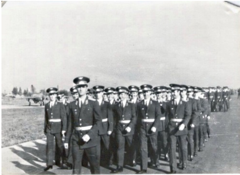
Прохождение торжественным маршем после вручения дипломов