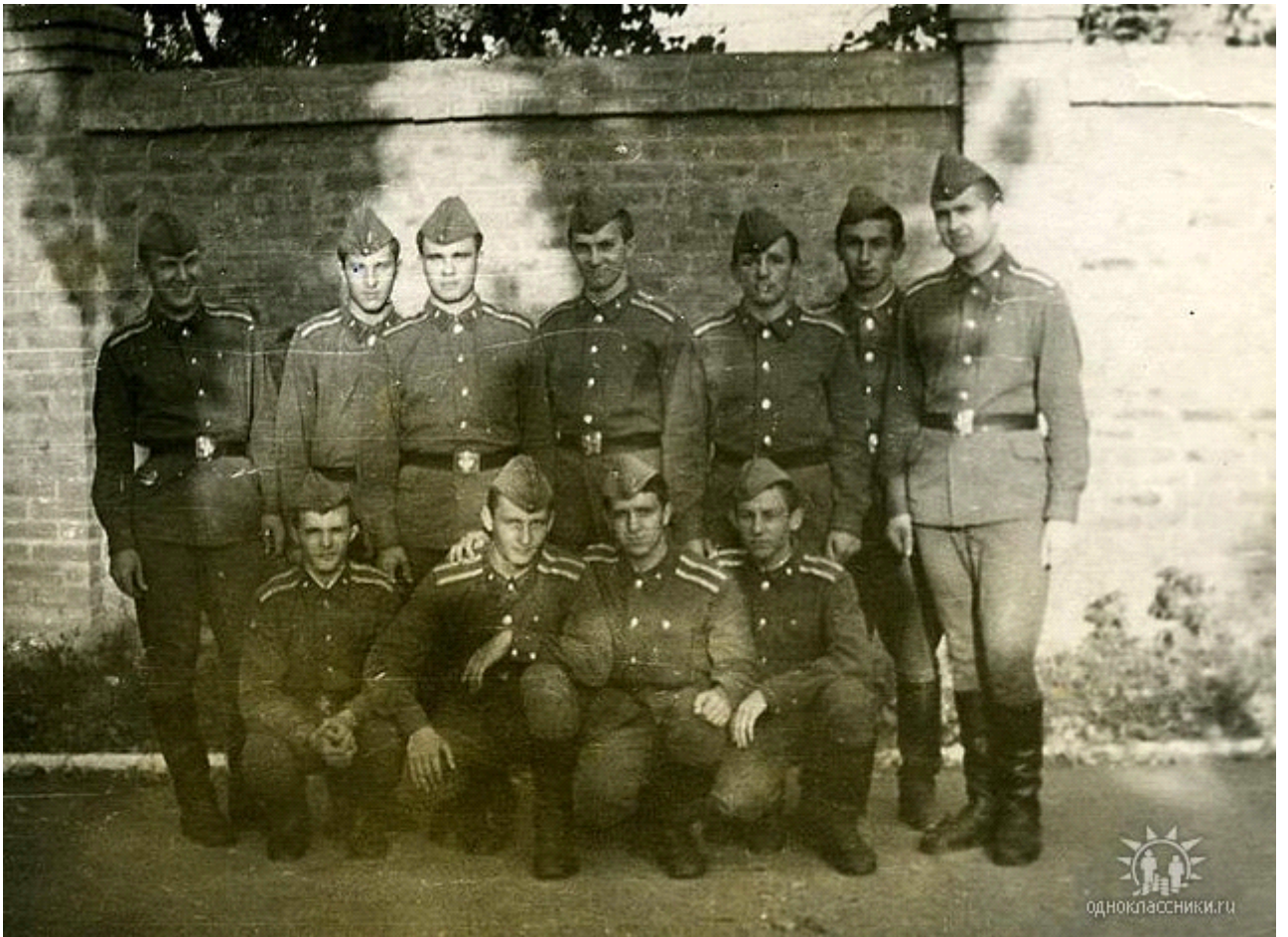
Наше первое отделение первого взвода второй роты. Временно исполняю обязанности командира отделения

- Если ты еще, дружок, поправишься на пару килограммов, мы тебя спишем. От таких слов меня прошиб холодный пот, внутри словно пустота образовалась. Конечно, я сказал, что больше не наберу лишнего веса. Но моим предположения не суждено было сбыться.... Уже к третьему ВЛК, я набрал еще до 89 килограмм. Контрольное взвешивание я сделала за несколько дней до ВЛК в санчасти училища. Это была уже для меня проблема, которую надо было как-то решать. Была середина ноября, но днем при безветрии солнце все так-же светило ярко, тепла уже было намного меньше. В удобную минуту мы выходили из казармы в курилку и там под косыми лучами солнца наслаждались краснодарской осенней погодой. На родине уже во-всю шли дожди, а у кого-то вперемешку со-снегом. А здесь стояла золотая осень с поспевшими напротив казармы яблоками, которые успешно были собраны курсанты еще задолго до их полного созревания.