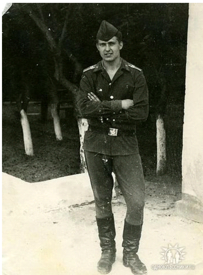
Второй курс. У штаба полка

- А сколько суток вам объявили, - продолжал любопытствовать я.