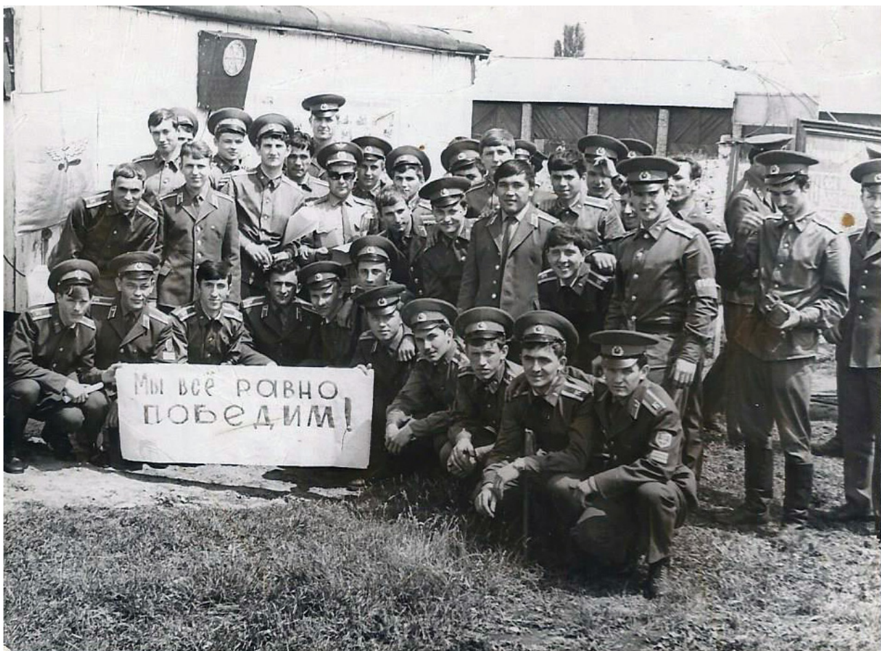
Конкурс песни 18-го августа 1975-го года. Я в задних рядах, как самый высокий

отойди я на пять минут на КПП? Да ничего! Но тогда... Тогда я смотрел на это другими глазами. Тогда я не мог подставлять солдата, который нас охранял. Да и... стыдно было, что сижу на гауптвахте.