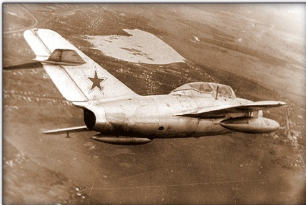
Ути Миг-15. Пилотаж в зоне